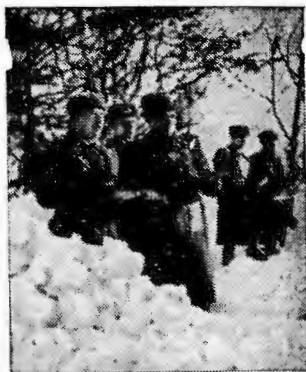
На первой странице обложки: «Решил...»