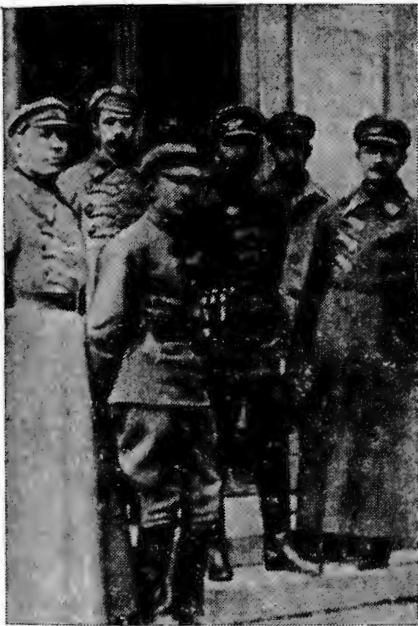
С. М. Буденный среди командного состава отряда ОСНАЗ.

Э то было 25 декабря 1921 года. Возвращаясь вечером в казарму, бойцы кавдивизиона неожиданно встретились с командармом Буденным. Семен Михайлович узнал среди них и тех, кто в составе автобронеотряда имени Я. М. Свердлова громил денкинцев и белополяков в рядах его Первой Конной. Завязался разговор, вспомнилось пережитое. Расставаясь, кавалеристы пригласили прославленного командарма