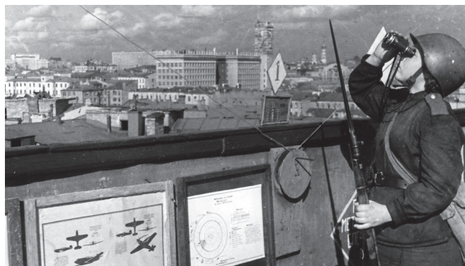
Рис. 4. Военнослужащий МПВО НКВД на посту. Москва, 1943 год

женных Сил, войска и органы НКВД СССР обеспечивали проведение оборонительных и наступательных операций Красной армии.