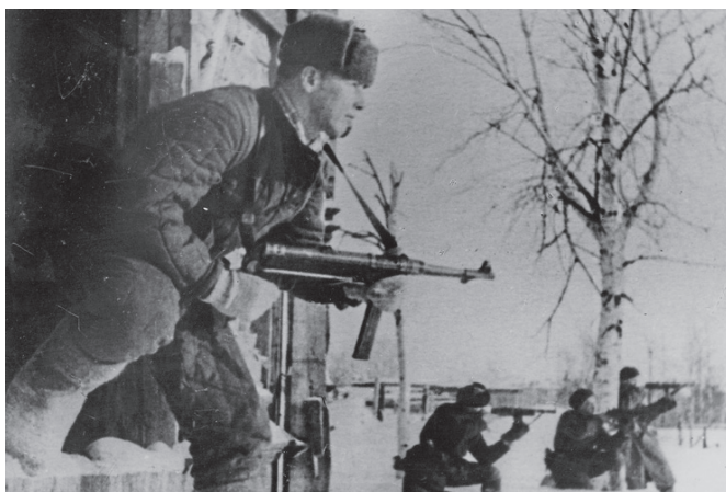
Рис. 3. Воины НКВД на выполнении задания в тылу врага

Соединения и воинские части войск НКВД СССР, находившиеся в районах боевых действий, перешли в подчинение командующих фронтами и приступили к выполнению задач по охране тыла действующей Красной армии.