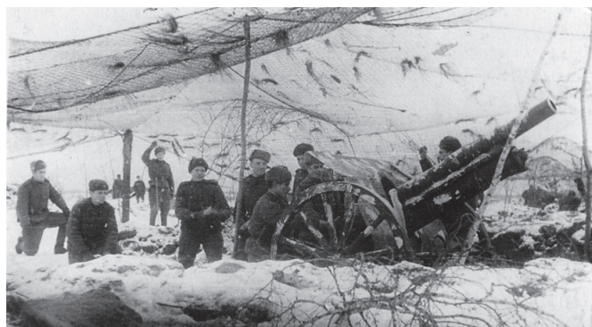
Рис. 5. Артиллеристы войск НКВД на Волховском фронте