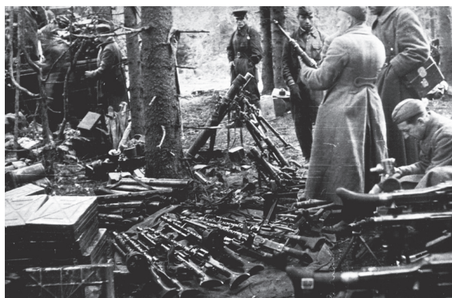
Рис. 6. Военнослужащие войск НКВД с собранным на полях боев трофейным оружием

Таким образом, войска НКВД СССР внесли весомый вклад в Победу нашей страны в Великой Отечественной войне. За мужество и отвагу более 100 тысяч военнослужащих войск были награждены орденами и медалями, из них почти 300 военнослу-