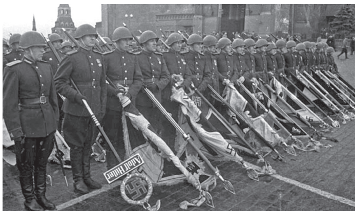
Рис. 2. Военнослужащие ОМСДОН в составе батальона трофейных знамен на Параде Победы

В наши дни войска национальной гвардии Российской Федерации (далее – ВНГ,