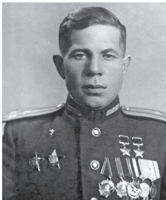
Рис. 8. Дважды Герой Советского Союза Шарухин Павел Иванович – в 1942 году заместитель командира 20-го мсп внутренних войск НКВД