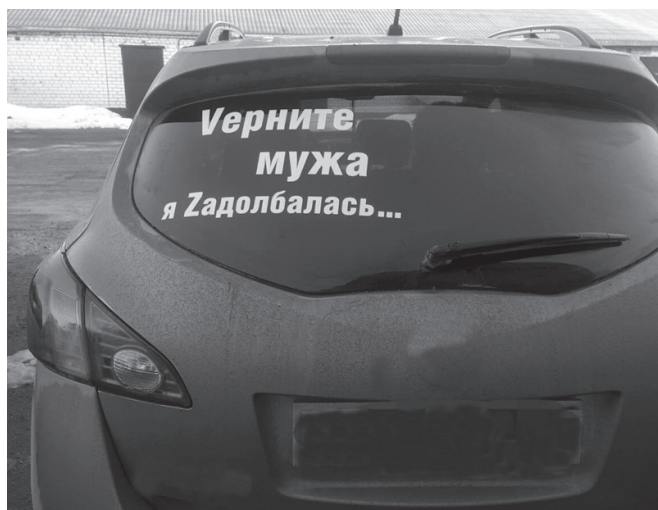
Рис. 1. Один из вариантов наклейки