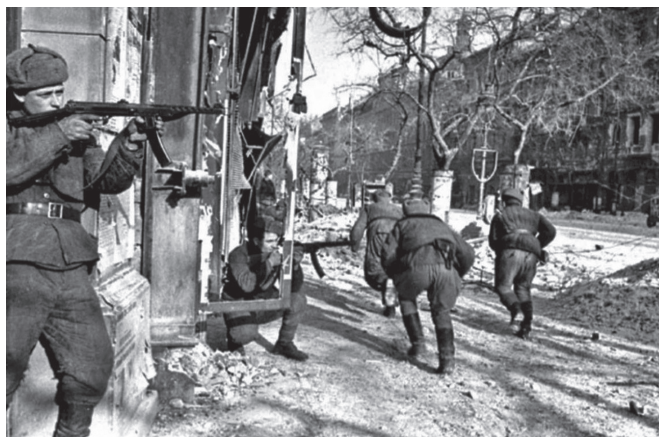
Рис. 2. Бои за г. Будапешт

родских кварталов. Захватывая указанные кварталы, личный состав вел бои за каждый в отдельности дом, часто переходя в рукопашные схватки. В ходе боев силами маневренной группы были освобождены от противника четыре городских квартала, кроме того, ее личный состав принимал участие в боях воинских частей Красной армии по захвату многих промышленных предприятий в городе (рис. 2).