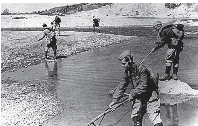
Рис. 3. Обследование берега реки

Всего в период с февраля по ноябрь 1943 года личным составом только саперного взвода ОББО в ходе инженерного обеспечения задач гарнизонной службы в городах Старобельск, Ворошиловград, Константиновка, городе Имени Кагановича 1 , Днепропетровск, селе Тишково было обезврежено 306 авиационных бомб, 847 авиационных гранат, 88 фугасов с различным типом действия, 70 противотанковых и 211 противопехотных мин, снято 1 030 зарядов, установленных на железнодорожном полотне, кроме того было восстановлено несколько мостов через р. Луганка, проведен ряд других фортификационных работ (рис. 3) [4, Л. 434–435об].