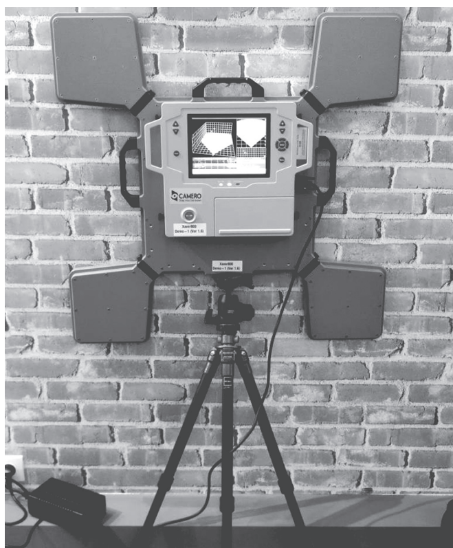
Рис. 2.

На эту тему достаточно много материалов, публикуемых научными организациями. Остановимся только на нескольких примерах практической реализации данного метода.