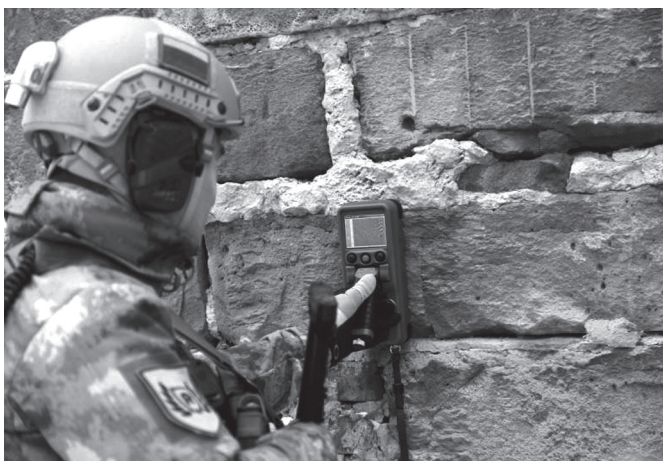
Рис. 1. Российский прибор РО-900

несколько вариантов исполнения [1]. Наиболее миниатюрные (рис. 1), помещающиеся в руке, предназначены для обнаружения присутствия человека (в том числе находящегося в неподвижном положении) по другую сторону стены.