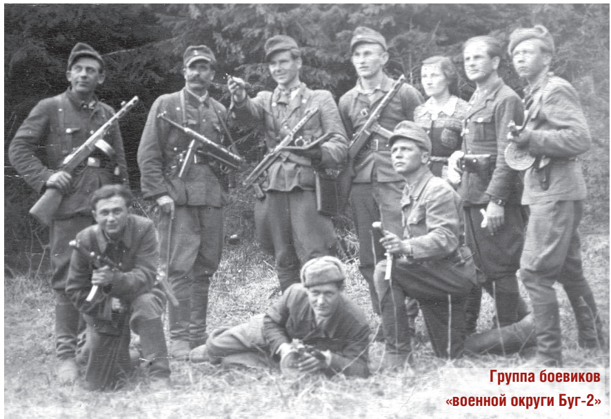
Группа боевиков «военной округа Буг-2»

Например, только за январь и первую половину февраля 1945 года внутренние войска провели 1311 специальных операций по ликвидации националистических банд, изъятию руководящего состава ОУН – УПА, захвату вооружения и продовольственных баз бандитов.