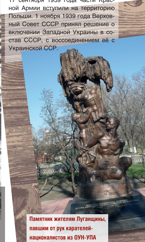
Памятник жителям Луганщины, павшим от рук карателей-националистов из ОУН-УПА