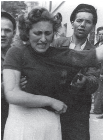
Львовский погром, в котором активно участвовали националисты из ОУН. Начало июля 1941 года