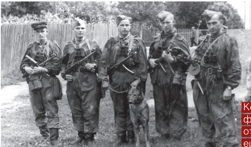
Разведывательно-поисковая группа ВВ НКВД

ций основная тяжесть борьбы легла на части Главного управления войск НКВД по охране тыла действующей Красной Армии. Однако по мере смещения театра боевых действий на запад ответственность переходила к оперативным органам НКВД и внутренним войскам Украинского округа.